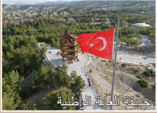
حديقة العناية الوطنية

لاحقا تم السيطرة على المنطقة من قبل هاميد أغلولارى في عام 1391 أصبحت المدينة تحت حكم الامبراطورية العثمانية. اشتهرت جولحصار بشكل خاص بالحرف اليدوية والسجاد والكليم خلال العهد العثماني. أصبحت الدمي المصنوعة من قماش ايبجيك تباع كهدايا تذكارية خاصة بالمنطقة. و قد أصبحت جولحصار مقاطعة عام 1953 و يبلغ عدد سكانها الحالي 22180 بالإضافة إلى تاريخها الغني تتميز جولحصار بأراضيها الخصبة ومواردها المائية. و قد أصبحت البيوت البلاستيكية و الزراعة التكنولوجية شائعة جدا كما أن الثروة الحيوانية أصبحت مصدر أساسي لكسب الرزق. ان جولحصار مزودة بمرافق مخصصة للاقامة تخدم زوارها على مدى العام.