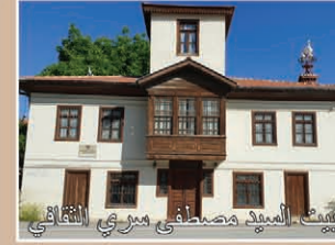
بيت العميد مصطفى ميري الثقافي