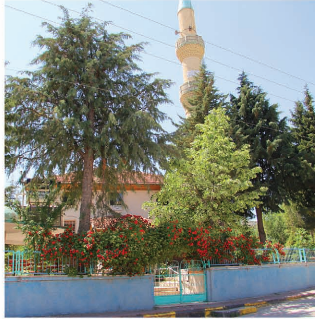
مسجد مركز يوكاري التاريخي استثنائي بزخارفه الخشبية المرسومة باليد

KEMER SU, SUT VE YAYLA DIYARINA HOŞGELDİNİZ